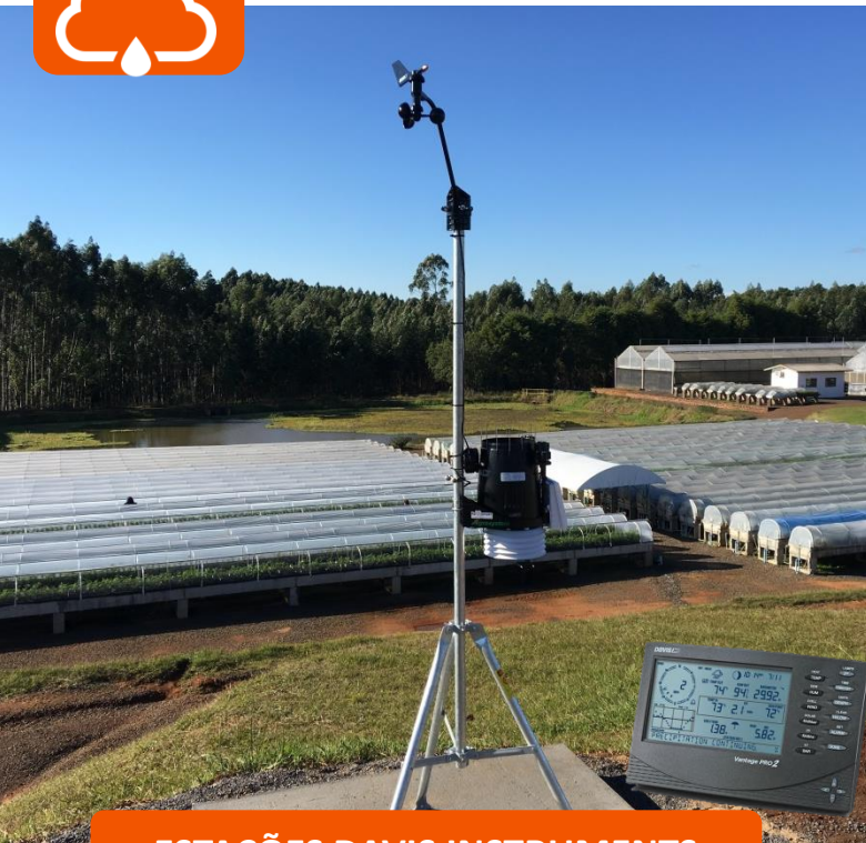
ESTAÇÕES DAVIS INSTRUMENTS